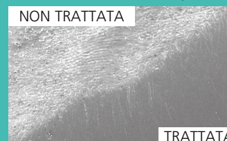
Superficie dello smalto non trattata e superficie trattata con Resin PoliStrip 15µm ingrandimento SEM 500x